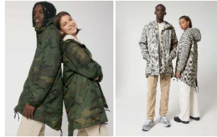
Padded Parker AOP Padded Parker Tweed