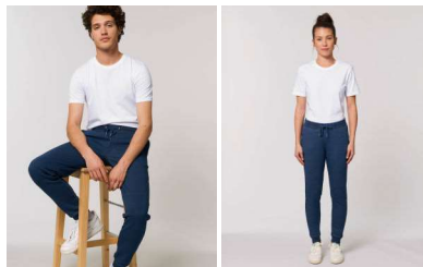
Stanley Stepper Denim Stella Tracer Denim

Wash similar colours together, no ironing on print, wash and iron inside out.